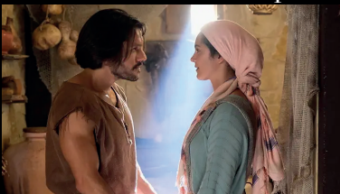
Retour à la maison