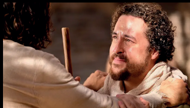
Deux par deux

Jeudi 4 septembre 20h15, épisodes 3 et 4