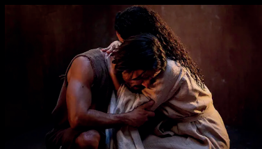
Intensité sous tente

Jeudi 18 septembre 20h00, épisodes 7 et 8