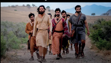
Des oreilles pour entendre

Jeudi 18 septembre 20h00, épisodes 7 et 8