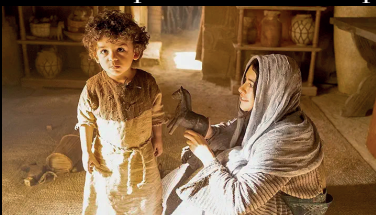
Médecin, guéris-toi toi-même

Jeudi 4 septembre 20h15, épisodes 3 et 4