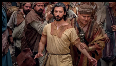
Nettoyer, partie 1

Jeudi 11 septembre 20h15, épisodes 5 et 6